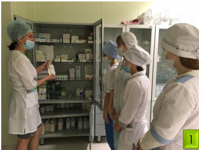
Ознакомление с фармакологическими группами лекарственных средств

Пройдя данные этапы мы переходим к самому интересному - это проведение практической части НМО. Это этап основной. От того насколько профессионально овладеют молодые сотрудники практическими навыками будет зависеть весь лечебный процесс. Из за большой ответственности, возложенной на данный этап, мы не можем использовать общую схему обучения специалистов. Каждый план подбирается индивидуально, исходя из уже имеющихся навыков.