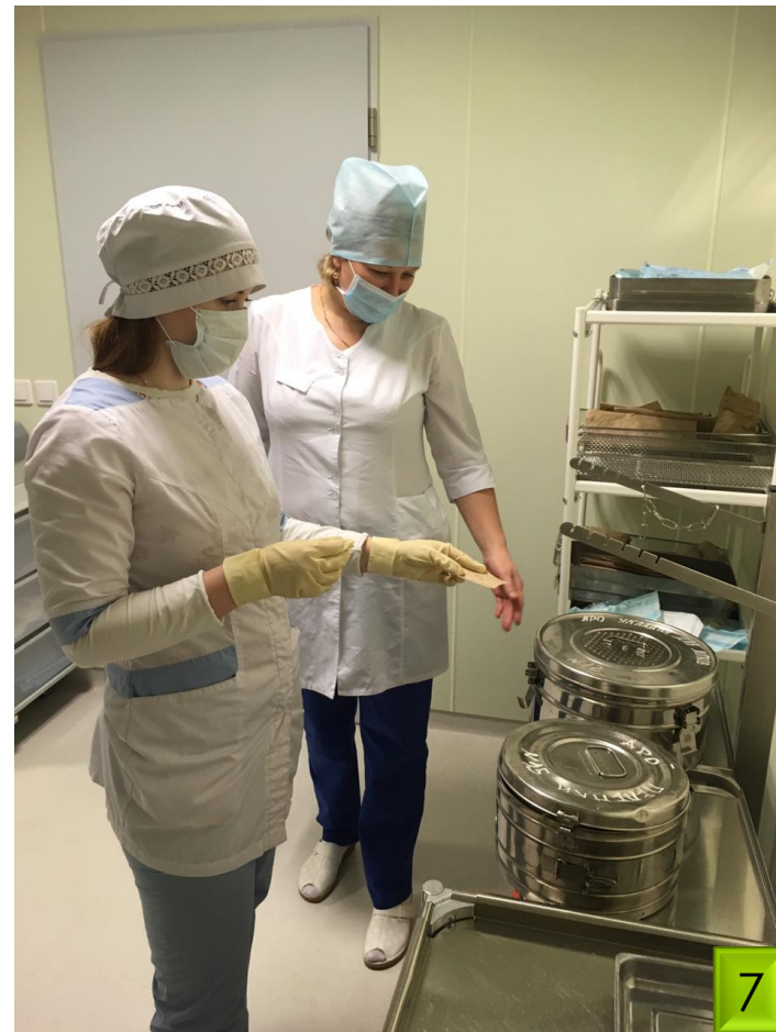
Подготовка аппаратуры к работе в палате пробуждения.