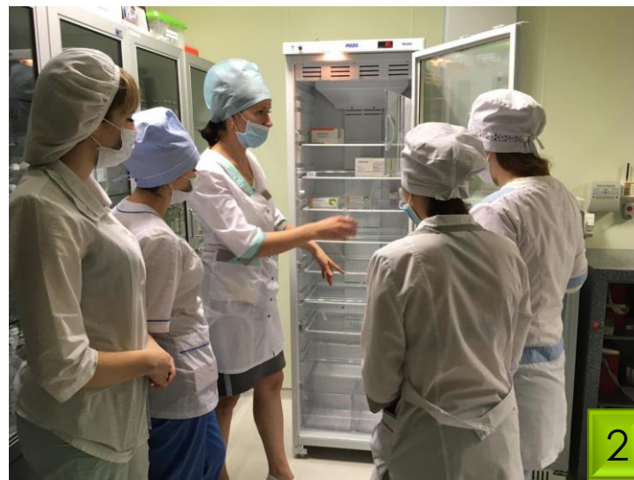
Хранение термолабильных препаратов