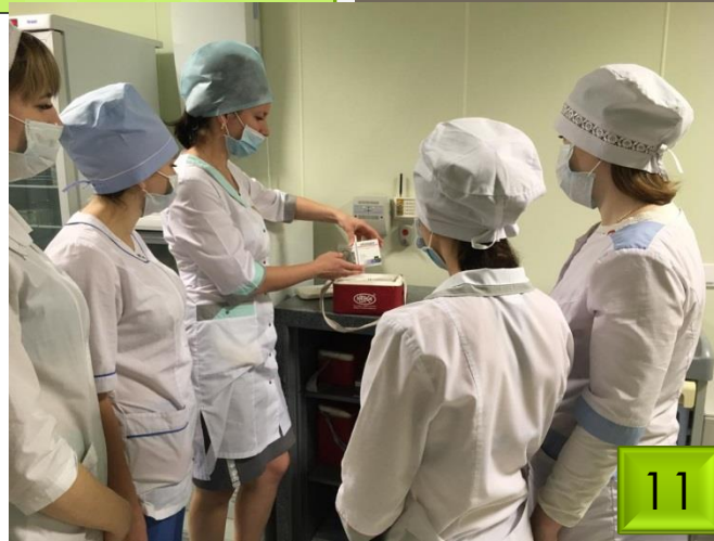
Хранение наркотических средств и психотропных веществ.