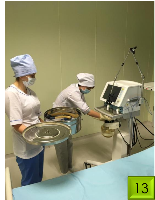
Подготовка аппарата ИВЛ SAVINA к работе