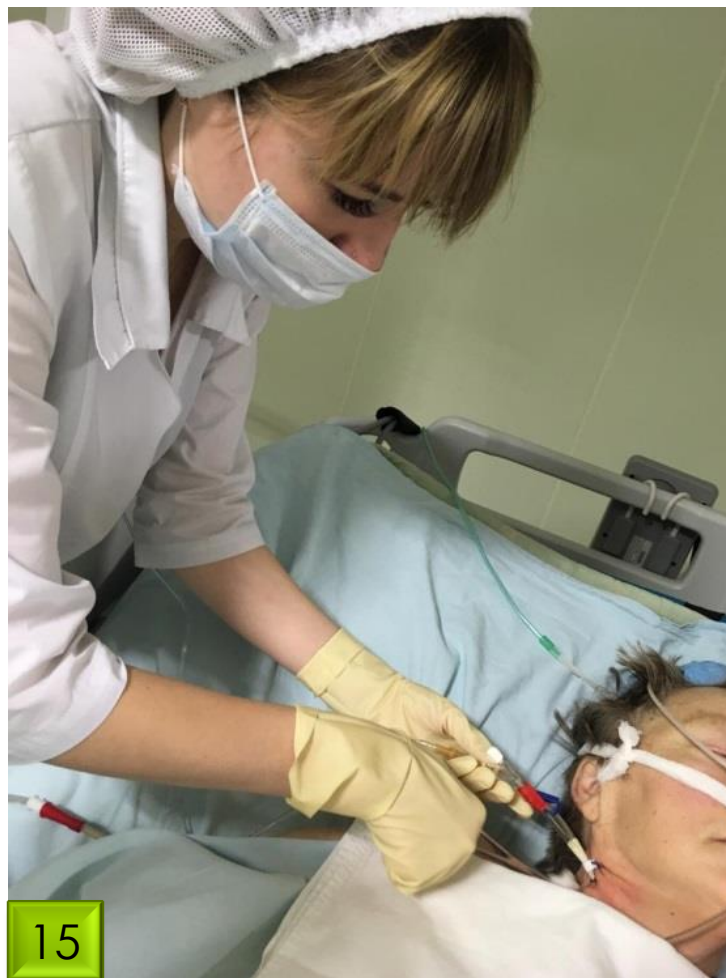
Обработка центрального венозного катетера