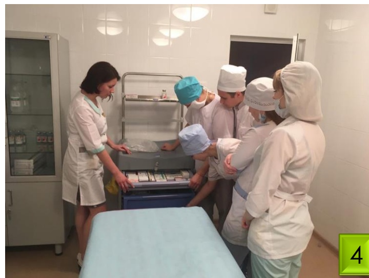
Дезинфекция изделий медицинского назначения